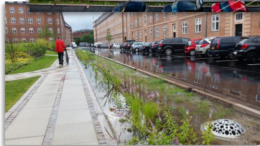
Taasinge plads Østerbro