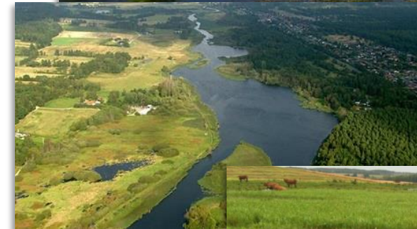
Vandet i det åbne land